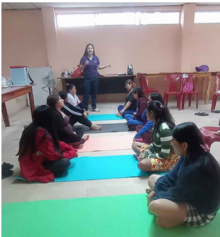
Fuente: Taller con embarazadas en la comuna Loma Alta